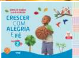
Crescer com Alegria e Fé (Ensino Religioso) Educação Infantil Vol. 2 (Nova Edição) Autores: Ednilce Duran e Glair Arruda Editora FTD