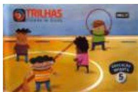
Trilhas Sistema de Ensino: (kit com 4 módulos) Educação Infantil 5 – VERSÃO A Autores: Vários Autores